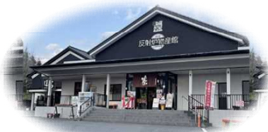
蔵屋鳴沢(伊豆の国市)