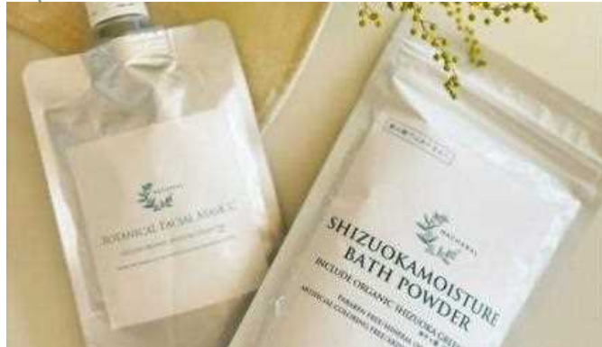
静岡県産の有機茶を使用した『フェイス・クレイパック』と『入浴剤』