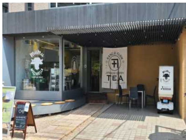
首都圏で約200店舗が参加