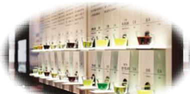
ふじのくに茶の都ミュージアム(島田市)