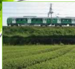
静岡鐵道 お茶ビール列車の運行