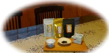
カネタ太田園(浜松市)