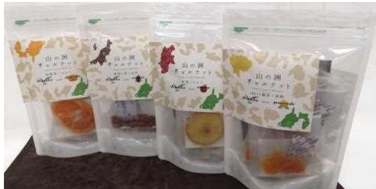
中部4県(山梨、長野、新潟、静岡)の特産物と静岡茶がコラボしたフレーバーティー『山の洲チャルテット(カルテット)』