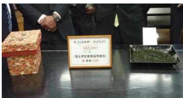
過去最高値を付けた富士宮産の手もみ茶