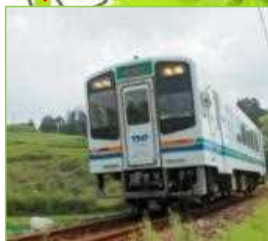
天竜浜名湖鐵道 お茶と食事・スイーツのペアリング