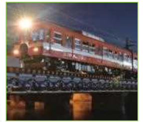
岳南鐵道 茶工場見学 及び茶摘み体験