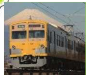
伊豆箱根鐵道 お茶ビール列車の運行