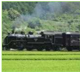
大井川鐵道 新茶呈茶サービス