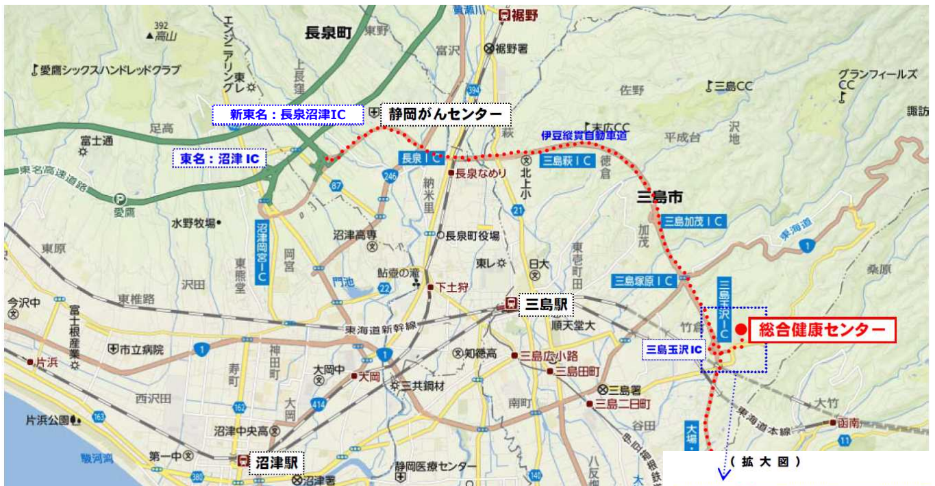
静岡県総合健康センター 施設写真