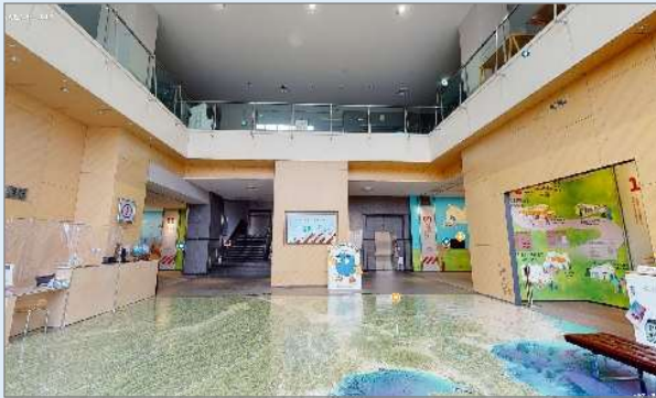
ツアー入口(センターエントランス)