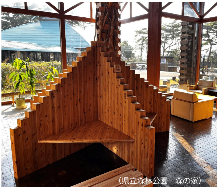
(県立森林公園 森の家)