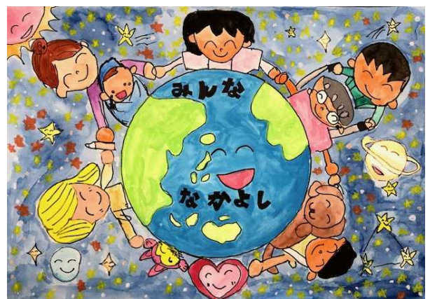
R3年度福祉のまちづくり絵画コンクール 県知事賞