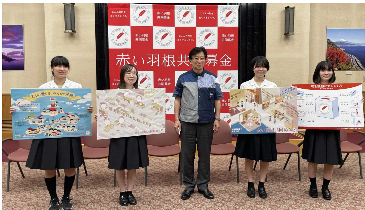
清水南高校の生徒による知事訪問（R4.7.25）

「若者向けプロジェクト」について報告するため、令和4年7月25日にデザインを担当した県立清水南高校の生徒（4名）が知事を表敬訪問