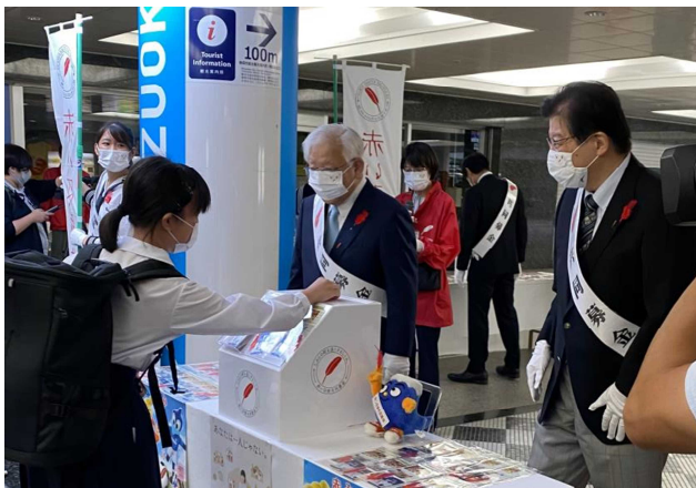
街頭募金キャンペーン（R2年度）

今年も、令和4年10月1日（土）午前11時00分から、 新静岡セノバけやき通り口にて、街頭募金キャンペーンを開始します。