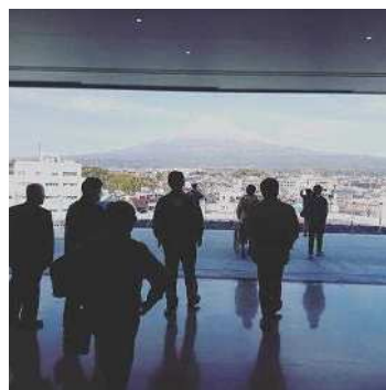
静岡県 富士山世界遺産センター