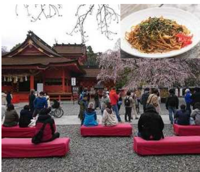
富士山本宮浅間大社

・県、富士山周辺4市1町（富士宮市、富士市、御殿場市、裾野市、小山町）及び観光関係団体の三者が連携し、面的に情報発信、観光商品の造成