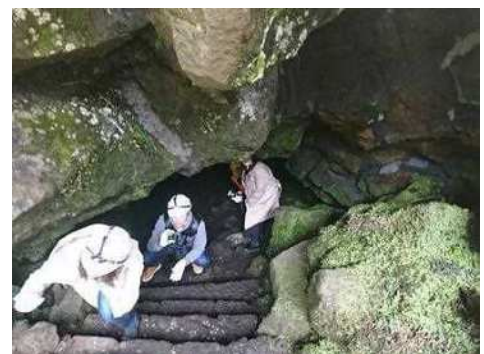
人穴富士構遺跡 (人穴体験)