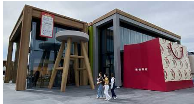
春華堂のコミュニティスペース