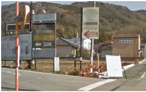
韮山反射炉周辺の交差点 （伊豆の国市）