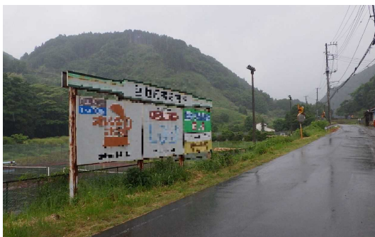
自然景観を楽しむ美しい沿道 （伊豆市）