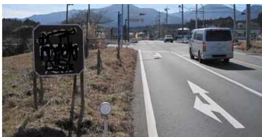
国道469号沿道（裾野市）