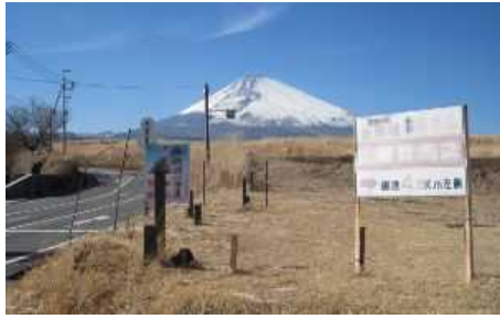
富士山の絶景を望むパノラマロード (裾野市)