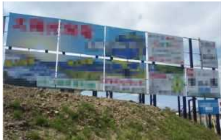
磐田インターチェンジ周辺（磐田市）