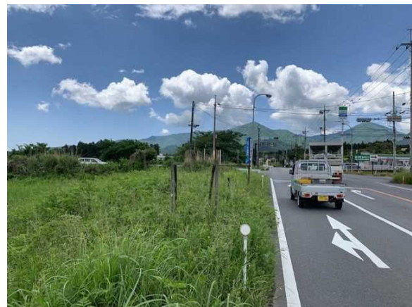
県道須走小山線沿道（小山町）