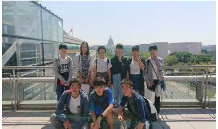
アクティビティ（国会議事堂見学）