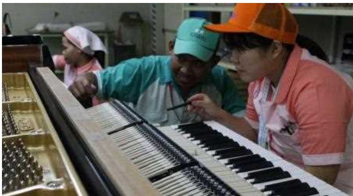
就労体験（インドネシア）