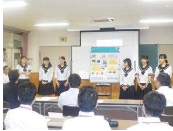
イングリッシュキャンプ