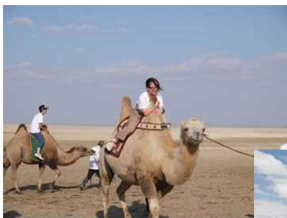
遊牧民のキャンプで らくだ体験