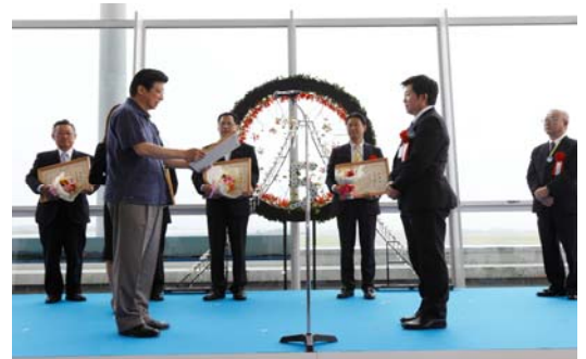
開港5周年記念式典の様子