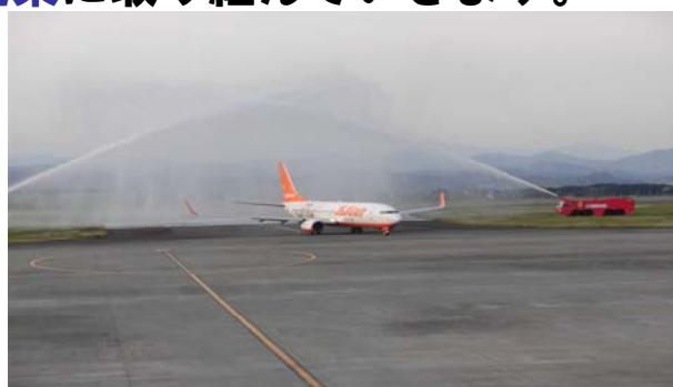
チェジュ航空静岡ーソウル線 一番機への放水アーチ

県、運営権者、促進協議会等関係団体が総がかりで、より便利に、より快適に、活気あふれる空港に向け、利用促進策に取り組んでいきます。