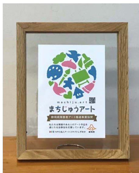
企業等へ贈呈する記念盾