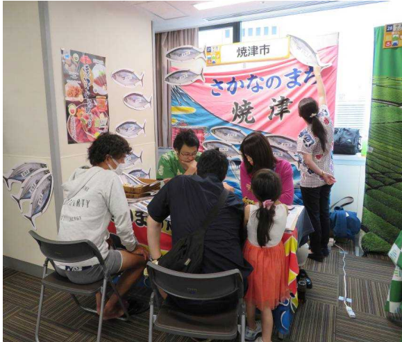
さかなのまち「焼津」