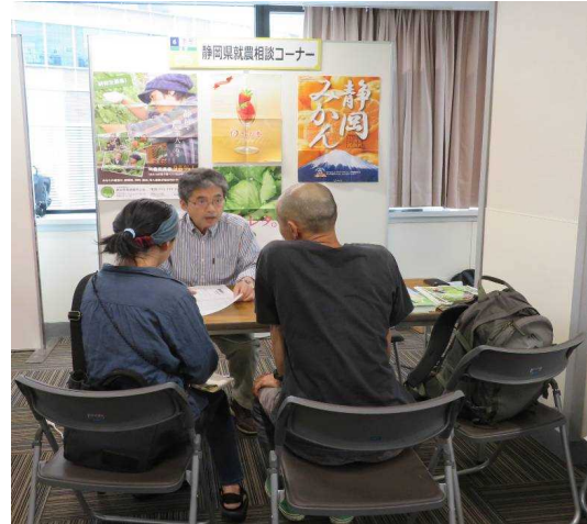
人気の高い就農相談コーナー