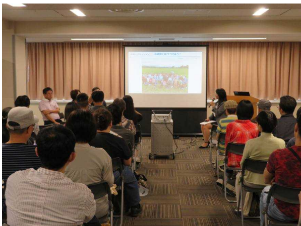
静岡県のお仕事事情