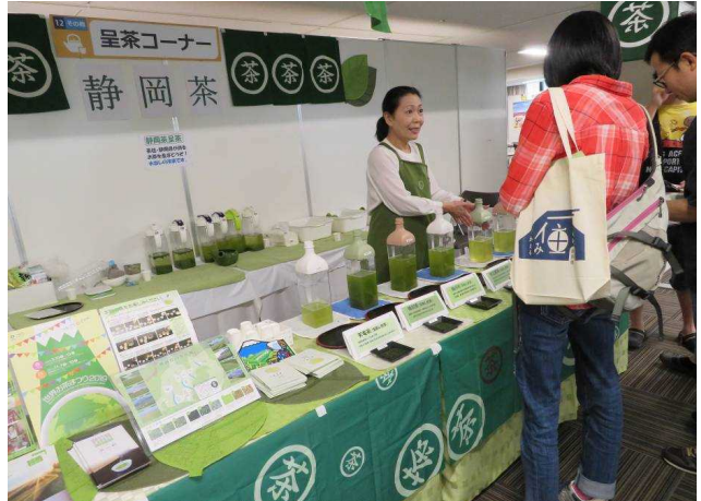
静岡茶の呈茶コーナー