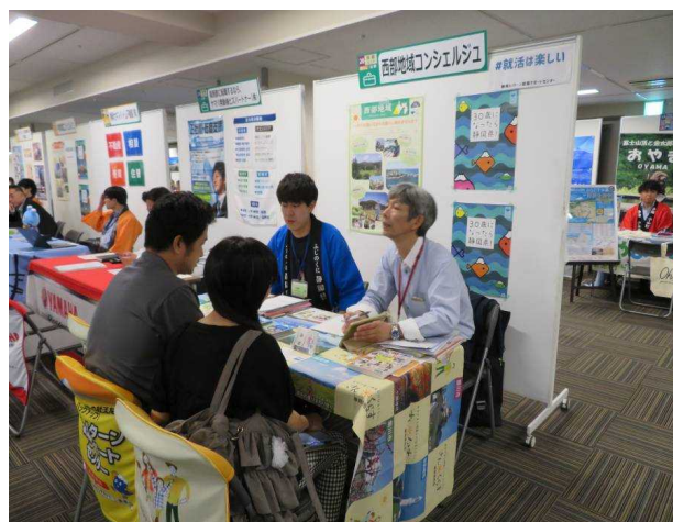
地域コンシェルジュを配置