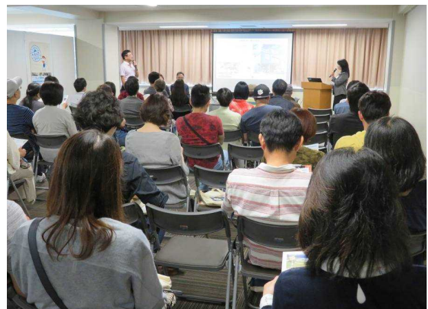
FPが語る静岡暮らしの家計