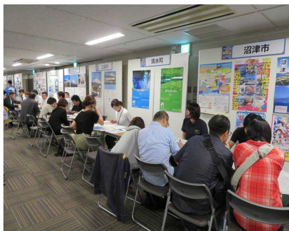
地域別に配置した相談ブース