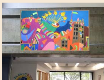
西館2階ロビー ふじさんっ子クラブ

・ 県が有償で借りた作品の原画、複製画を、まちじゅうアートのモデル事業として展示