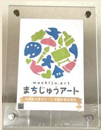
企業等へ贈呈する記念盾