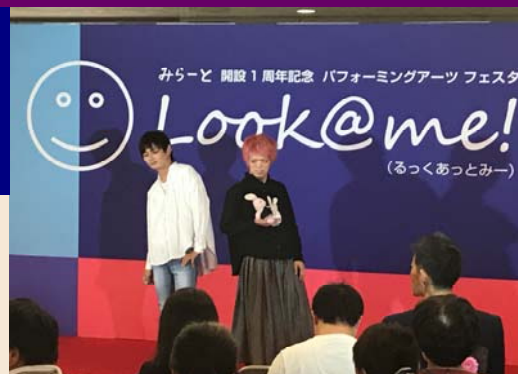
<障害のある人がモデルを務めたファッションショー>