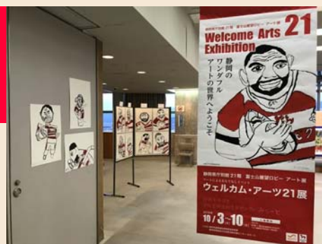
<ラグビー日本代表 リーチ選手を描いた作品>