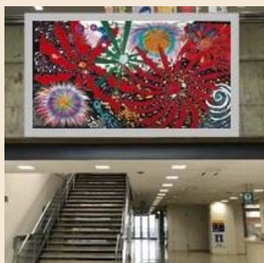
西館2階ロビー 正面 「21世紀の花火」

・ 旧ねむの木学園美術館に展示されていた手書き友禅の複製画を展示。(県が寄付受納)