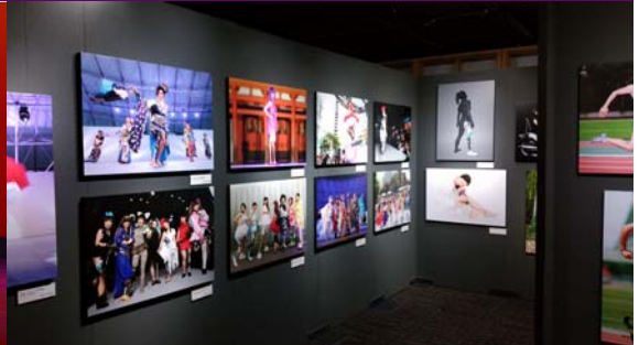
パラアスリートを題材とした写真展