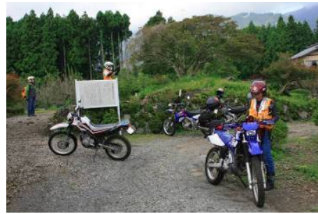
文化財被災状況把握訓練(バイクボランティア)

万一の災害時に被災した文化財を救済するために、県内大学研究室、博物館、NPO等59団体で構成する連携組織