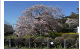
狩宿の下馬ザクラ