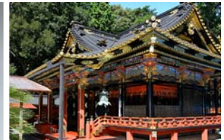
久能山東照宮 本殿