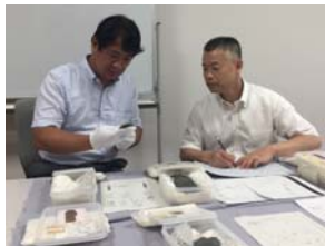
指定候補・重要文化財の調査(旧石器の調査、石丁場の調査)