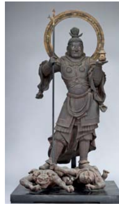
木造毘沙門天立像