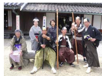
時代衣装でお出迎え