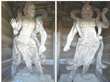
平成30年度指定 木造金剛力士立像 2軀 (静岡市霊山寺)