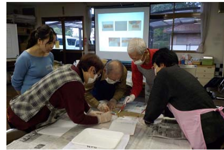
文化財等救済支援員ステップアップ講座

災害時における文化財の被害報告や応急措置を行うボランティア396名を登録し、研修等を実施