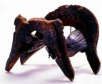
平成30年度指定 黒漆塗瓜文鞍 (県埋蔵文化財センター)