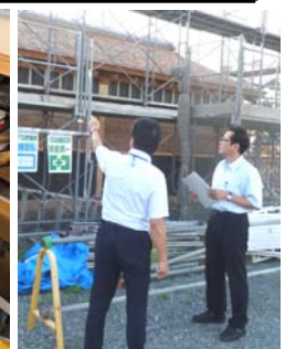
整備の指導(新居関跡)