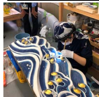
楼門彫刻の修理(静岡浅間神社)