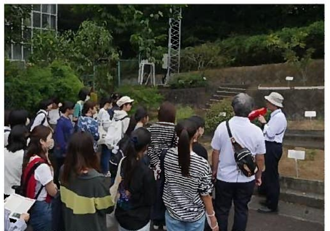
薬草講座(静岡県立大学薬草園ほか)