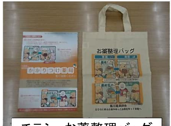
チラシ、お薬整理バッグ