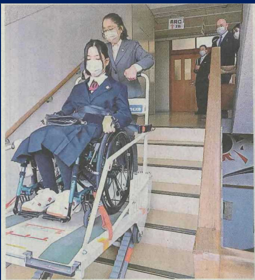
伊豆伊東高校の生徒