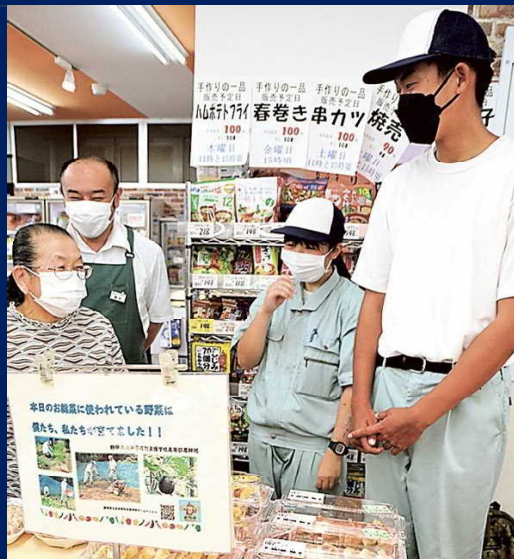
スーパーでの作業製品販売