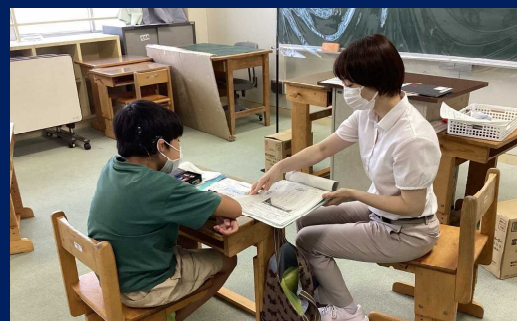
聴覚特別支援学校での通級指導教室