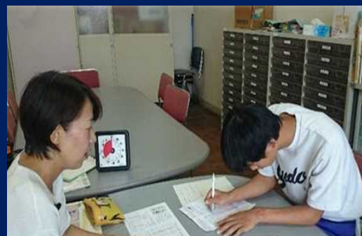
小学校での通級指導教室