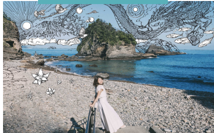
佐津川さんをうちださんが撮影。 内田さんがイラストを重ねた。