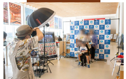
うちださんによる写真撮影会。 空港での思い出を写真に残した。