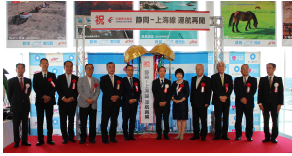
9/24 運航再開記念式典