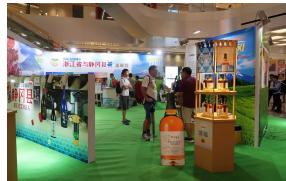
商業施設（杭州市内）での本県PRブース