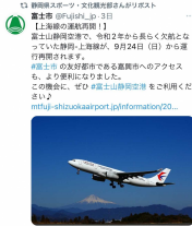
県内市町の協力によるSNS発信