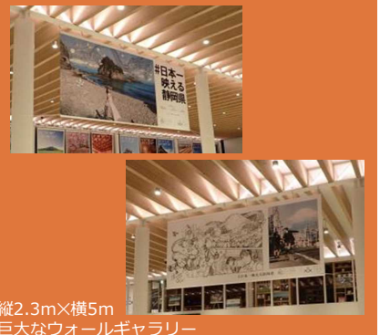
縦2.3m×横5m 巨大なウォールギャラリー