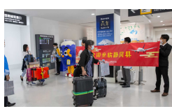
運航再開のメディア露出