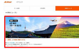
公式における静岡線PR