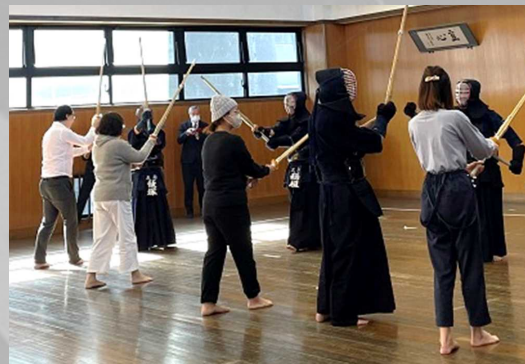
剣道体験会の様子 (三島市)

◆訪日外国人が見たいスポーツ 第1位 武道、第2位 大相撲、 第3位 野球、第4位 サッカー (スポーツ庁調べ)