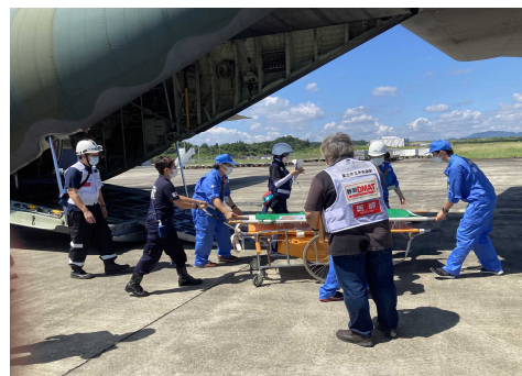
R4 広域医療搬送拠点開設・運営訓練 (富士山静岡空港)