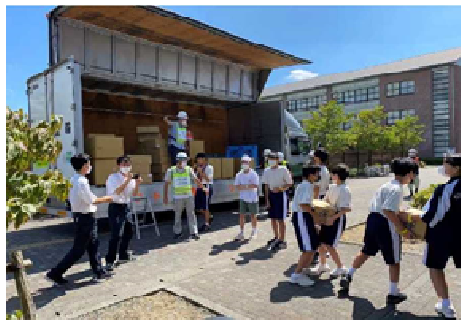
R4 避難所における物資搬入 (島田第一中学校)