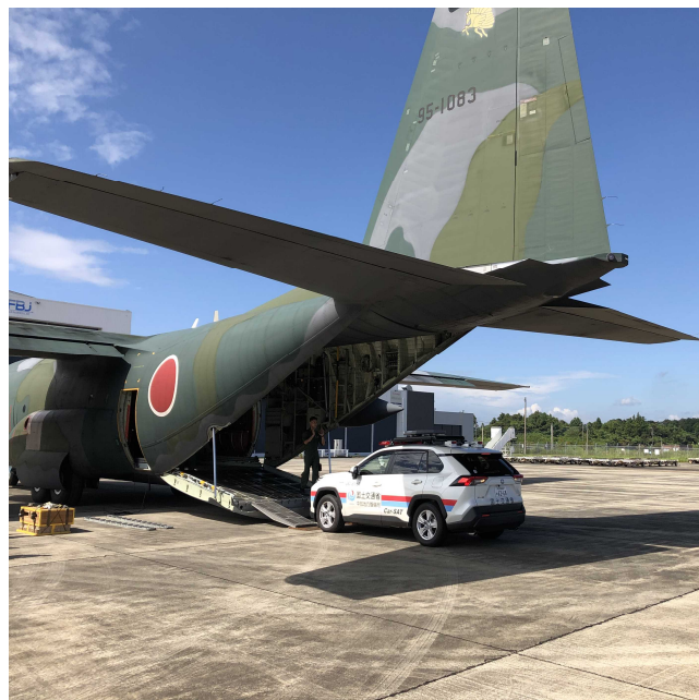
危機管理部 危機対策課