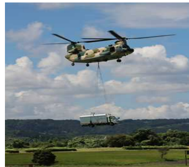
R4 高圧発電機車懸吊訓練 (大井川緑地)