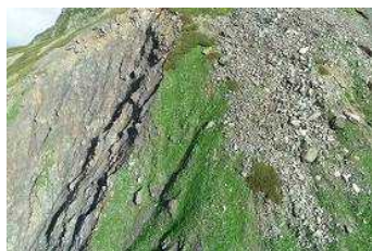
キタダケヨモギ群生地