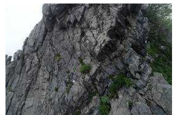
岸壁に生育する高山植物