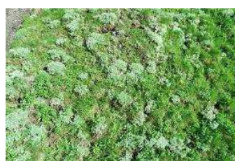
キタダケヨモギ (薄緑色の植物)