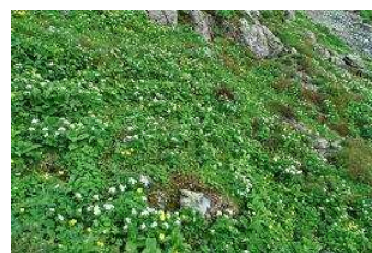
ニホンジカの食害を 受けていないお花畑