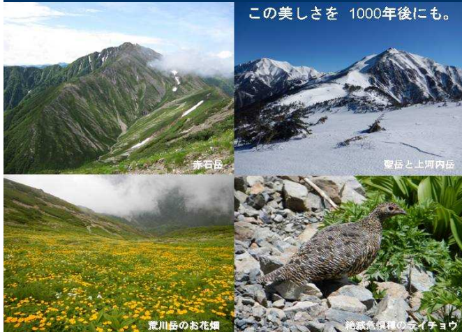
この美しさを 1000年後にも。