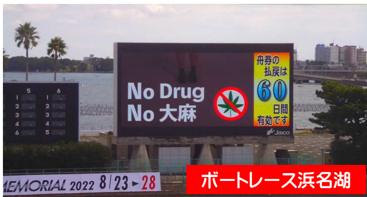
ボートレース浜名湖