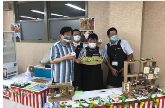
「一人一品運動」協力隊