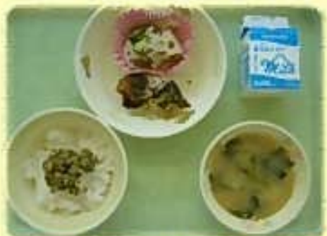
【県立富士特別支援学校】 しっとりお茶ふりかけ