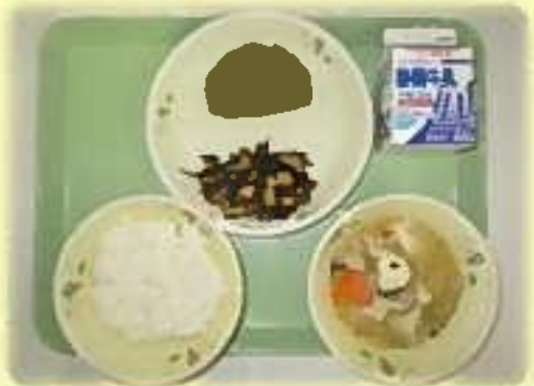
【藤枝市】黒はんぺんの藤枝茶あげ