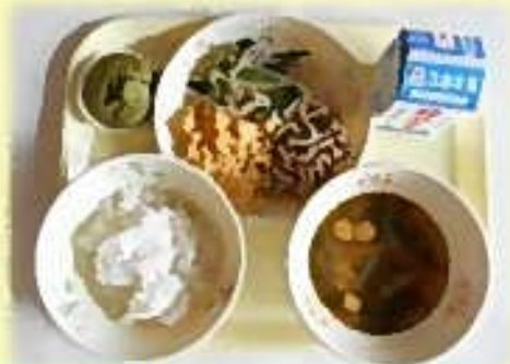
【沼津市】沼津茶と豆腐のマフィン