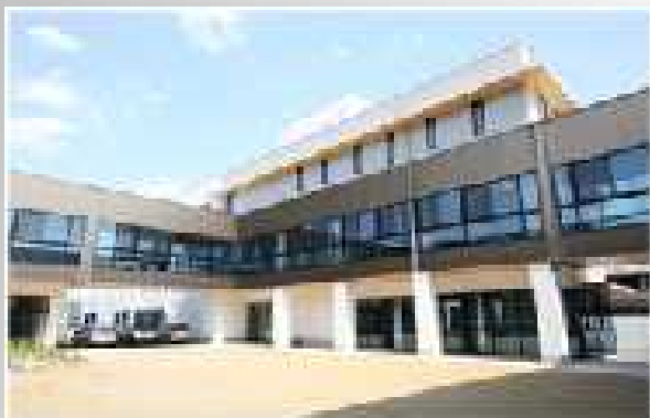
工科短期大学校 静岡キャンパス