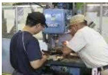
機械基本・フライス盤 (一般コース)