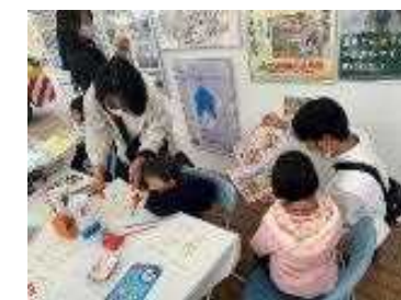
建設産業の魅力を伝えるイベント