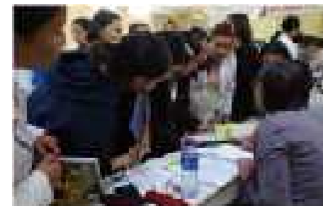
モンゴル国現地合同面接会