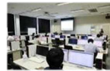
沼津キャンパス 情報技術科