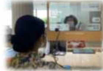
翻訳ディスプレイの設置

（取組事例） 翻訳ディスプレイの設置⇒約0.3人工の補完 社員寮各部屋へのトイレ・シャワーブースの設置 等