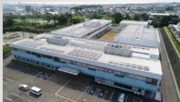
工科短期大学校 沼津キャンパス