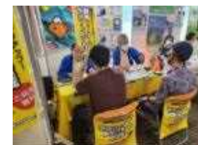
右：都内での就職フェア