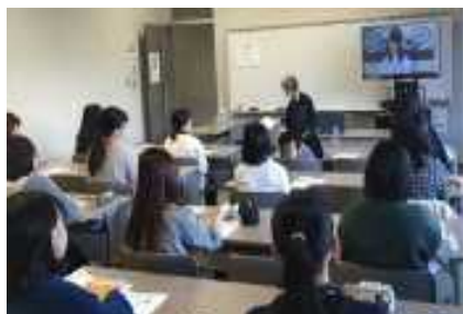
本県支援制度を学内で説明