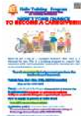
<介護系コースチラシ>