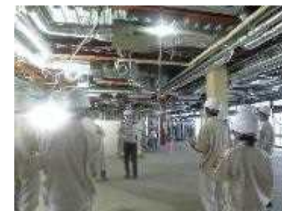
掛川工業高校 現場見学会