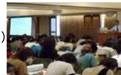
保育士等キャリアアップ研修