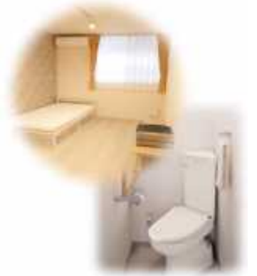
従業員宿舍施設の改修