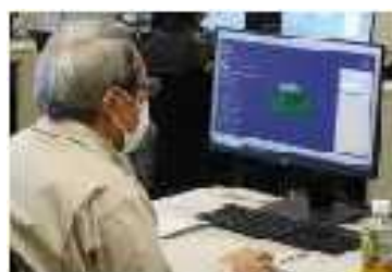
はじめての5軸加工機(同時5軸編) (デジタルコース)