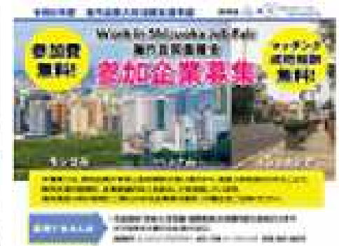
<面接会参加企業募集チラシ>