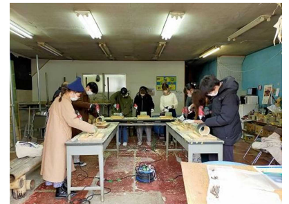
竹灯籠作り体験 (竹たのしみまくる下田)