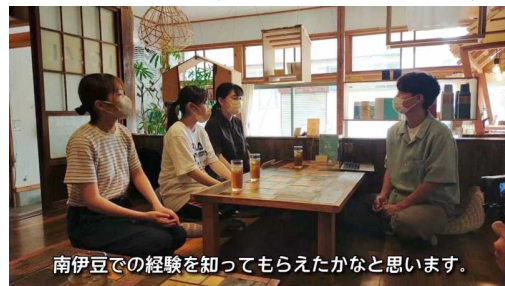
平井製菓(ライブ配信)