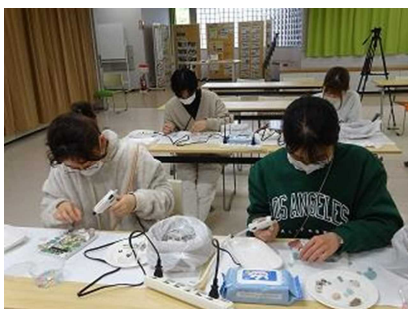
シークラフト体験 (し～もん)