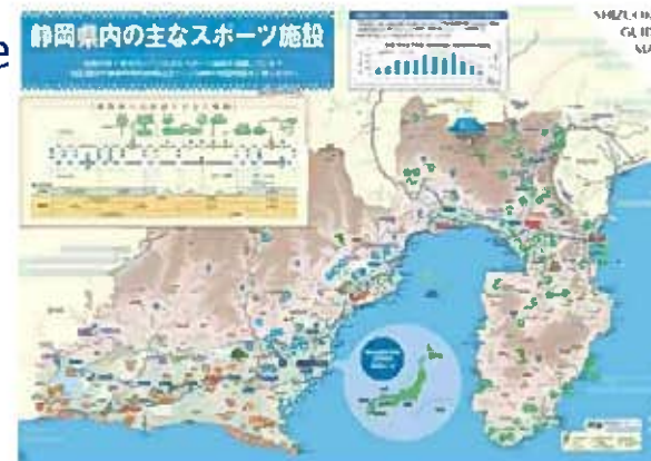
大会・合宿誘致の推進