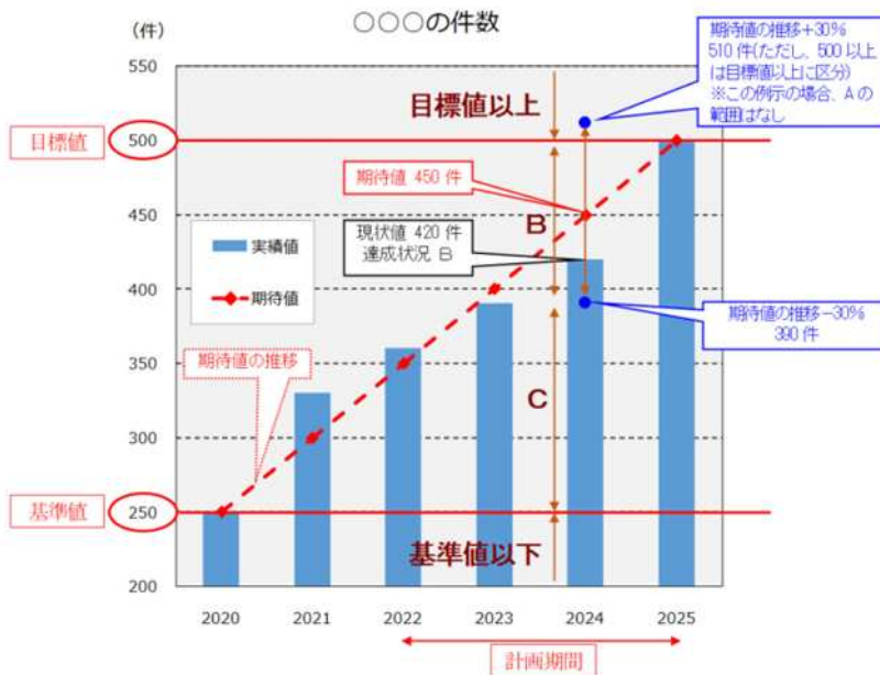
【基準値が目標値の85%未滿の場合】

※ 計画最終年度（2025年度）に目標を達成するものとして、基準値から目標値に向けて各年均等に推移した場合における各年の数値を「期待値」とする。