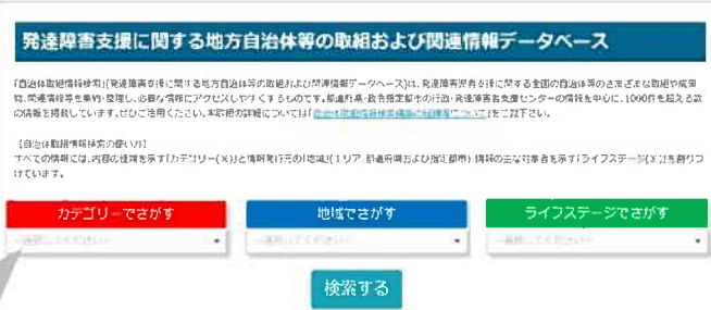
▲「自治体取組情報検索」の情報検索画面