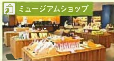
静岡のお茶やお茶を使ったお菓子など、さまざまな商品を販売しています。