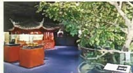
お茶の起源と世界の喫茶文化