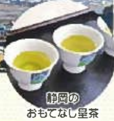
静岡の おもてなし呈茶