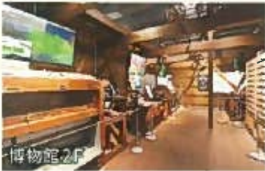
静岡の古い製茶小屋(再現)

映像や体験展示(茶葉を触る、香りを嗅ぐなど)が多くあり、静岡及び世界のお茶について、産業、文化、歴史、民俗などを楽しく学ぶことができます。