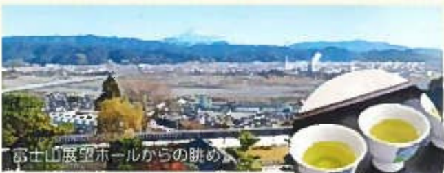
眼下に大井川、好天時には富士山を 望むことができます。