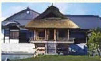
江戸時代の大名茶人「小堀遠州」が手がけた茶室を正確に復元しています。