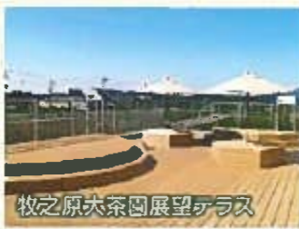
牧之原大茶園展望テラス