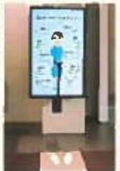
お茶の健康診断 世界の茶葉ギャラリー