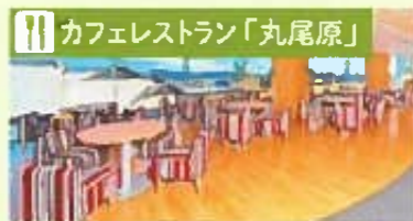
静岡の産材を使ったメニューをお楽しみいただけます。(44人まで利用可)