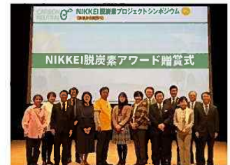
NIKKEI 脱炭素アワード授賞式