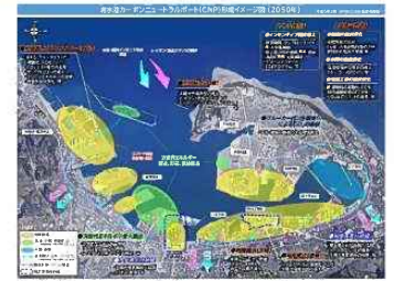
清水港CNP形成イメージ図（2050年）

※スマートガーデンポート：令和元年8月に策定公表した清水港長期構想（目標年：2040年）の基本理念