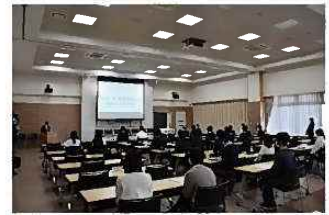
ゼロカーボン提案発表会