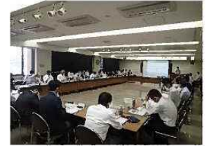
清水港CNP協議会 開催実施