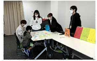
大学生企画の環境イベントの様子

静岡市は、静岡鉄道（株）と連携のもと、高校生・大学生による脱炭素社会の実現に向けた提案発表会「ゼロカーボン提案発表会 ～静岡市の未来を切り開け～」を開催し、学生が、自分たちで考えた様々な取組を市長などに提案しました。