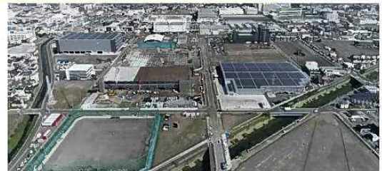
整備が進む恩田原・片山エリア

静岡市の脱炭素先行地域は、「脱炭素を通じて新たな価値と賑わいを生む『みなとまち しみず』からはじまるリノベーション」をテーマとし、清水駅東口エリア、日の出エリア、恩田原・片山エリアの3エリアで、民間企業と連携を図りながら実現に向けた取組を進めていきます。