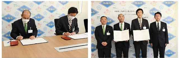
協定締結式の様子

この協定は、熱海市と熱海ガス（株）が相互に連携し、それぞれが持つ脱炭素社会に関する知見や技術を活用した取組を推進することにより、脱炭素に関する情報を市内外に幅広く発信するだけでなく、市民に地球温暖化の防止に対する関心や意識を高めていただき、ゼロカーボンシティの実現に寄与することを目的に締結されました。