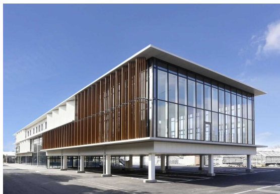
農林環境専門職大学外観