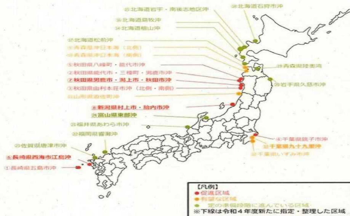
促進区域、有望な区域等の指定・整理状況 (2022年9月30日)