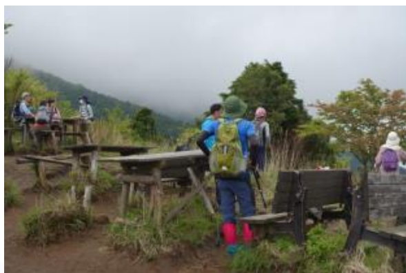
愛鷹連山を登るハイカー