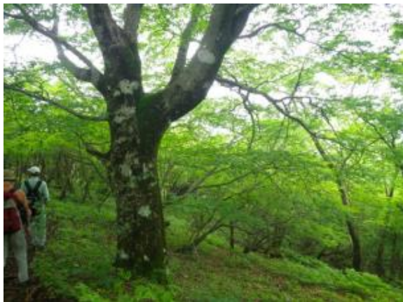
登山道付近の森林状況