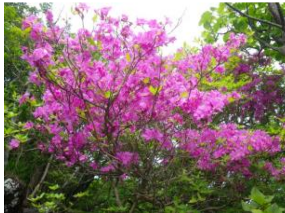
アシタカツツジ(県固有種)