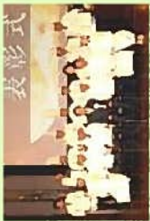
ふじのくに食の都づくり仕事人