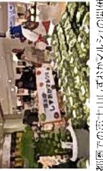
首都圏での富士山しずおかマルシェの開催