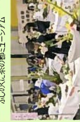
高校生を対象としたフラワーデザインコンテスト