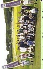
ふじのくに美しく品格のある邑づくり