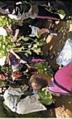
小学生のわさび植え付け体験