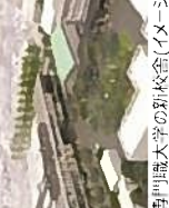
専門職大学の新校舎(イメージ)