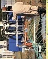
茶園管理機をベースに開発されたロボット用管理機