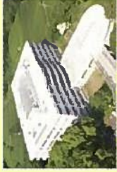
AOI-Parc (アグイパーク) * Agri Open Innovation Practical and Applied Research Center