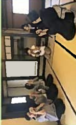
ふじのくに茶の都ミュージアム