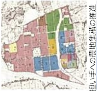
担い手への農地集積の促進