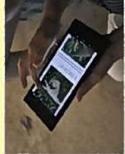
栽培技術を情報端末で学習