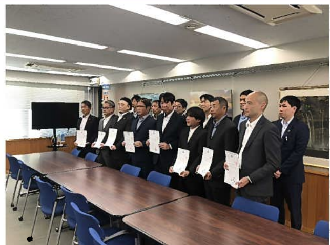
認証書交付式の様子