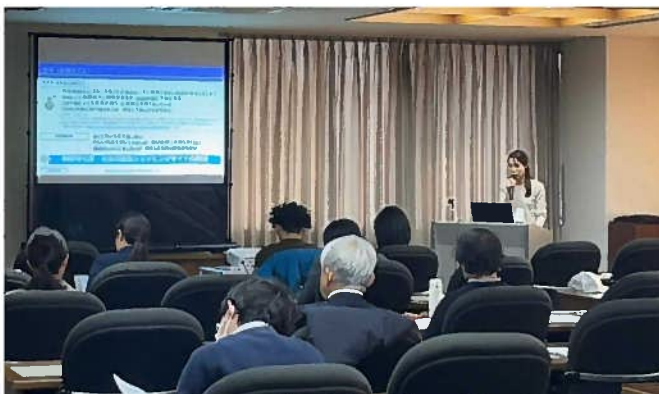
サービス企業等による取組発表