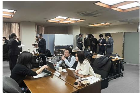
食品関連事業者との相談会