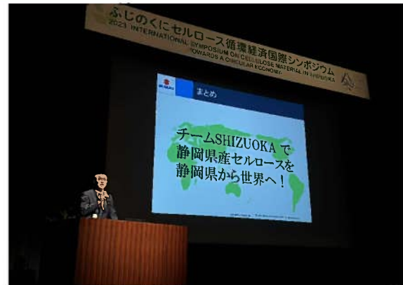
ふじのくにセルロース循環経済国際シンポジウム

植物由来素材の世界最大級の展示会「ふじのくにセルロース循環経済国際展示会」及び欧米や東アジアの著名な研究者や国内大手企業を招いた国際シンポジウムを開催