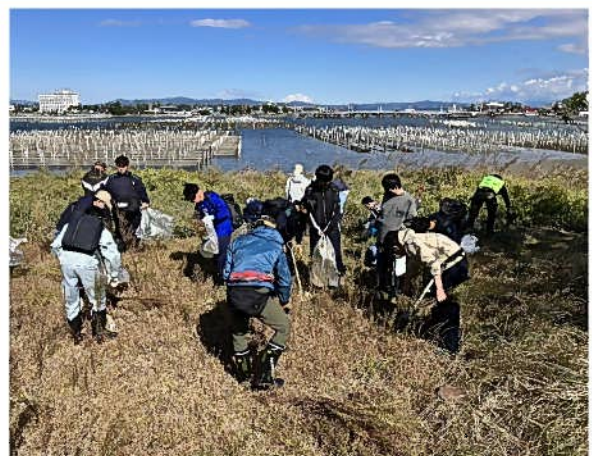
「いかり瀬」外来植物除去活動