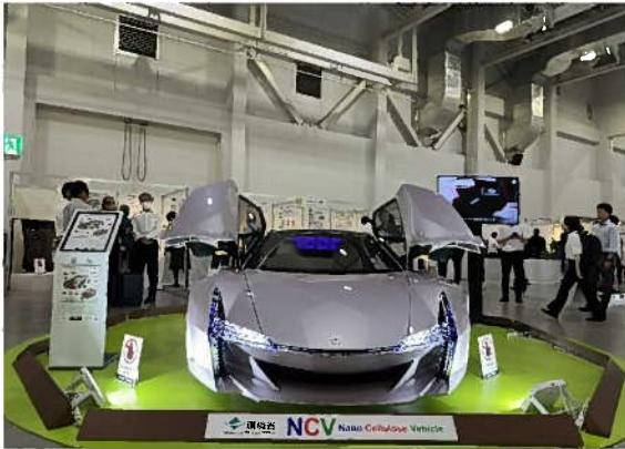
ふじのくにセルロース循環経済国際展示会 (ナノセルロースヴィークルの展示：環境省)