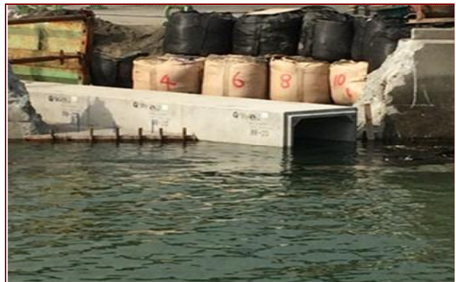
山口県 ボックスカルバート