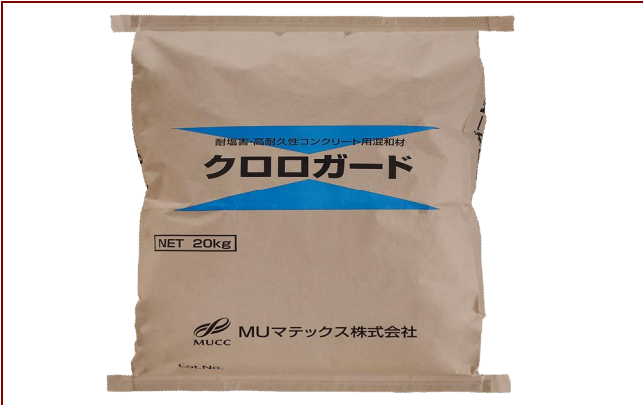
クロロガード荷姿(20kg紙袋)