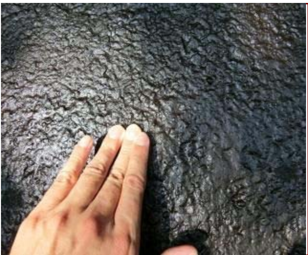
散布直後指触状況