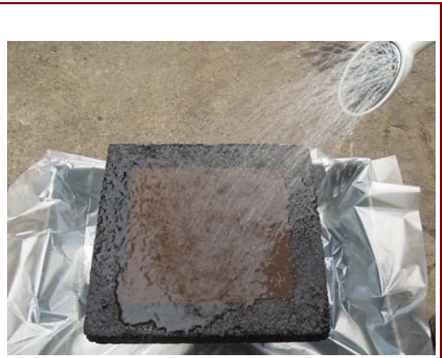
乳剤流出防止確認試験状況