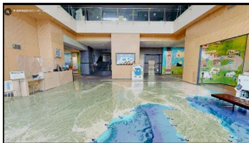
ツアー入口(センターエントランス)