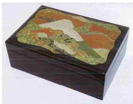
富士山園木目込文庫(江戸時代)