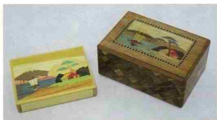
寄木細工秘密箱(昭和時代)