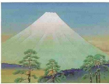
松岡映丘筆「富士」(昭和時代)