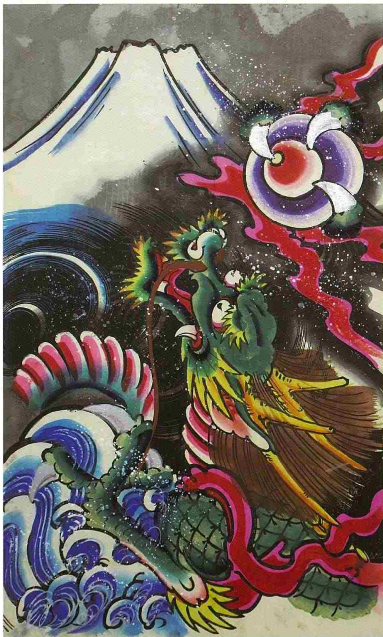
江戸風絵「富士越龍」橋本禎造画（昭和時代）