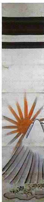
富士山図旗(明治時代)