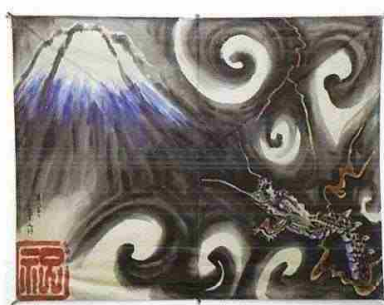
ぶか凧「富士越龍」藤原政雄作(昭和時代)