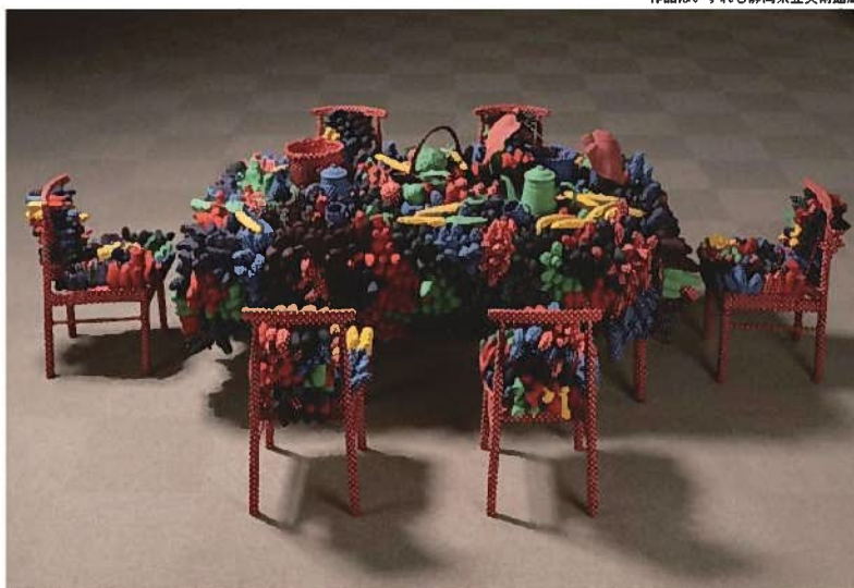
草間彌生《最後の晩餐》© YAYOI KUSAMA

*2021年、レイチェル・カーソン著、上遠恵子訳「センス・オブ・ワンダー」新潮社(新潮文庫)を参照しました。 *会期中、一部展示替えがあります。