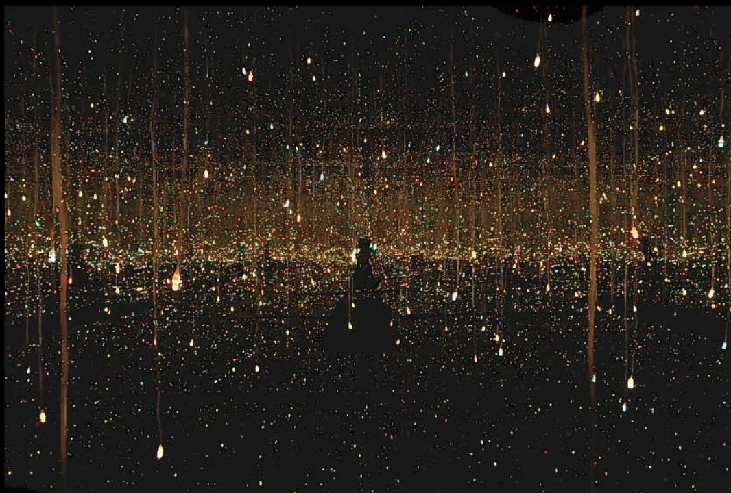
草間彌生《水上の星》© YAYOI KUSAMA