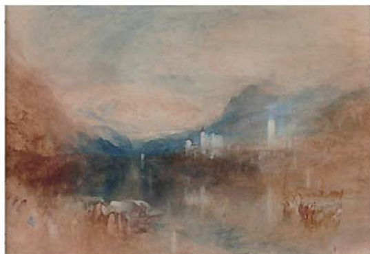
ジョセフ・マロード・ウィリアム・ターナー《パランツァ、マッジョーレ湖》