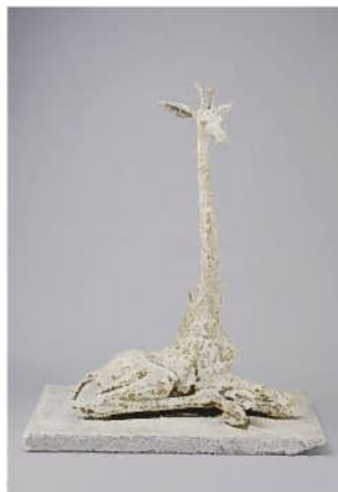
渡井敏夫《幼いキリン・堅い土》