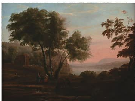
クロード・ロラン《笛を吹く人物のいる牧歌的風景》