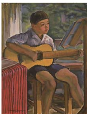
赤城素舒《ギターを弾く少年》