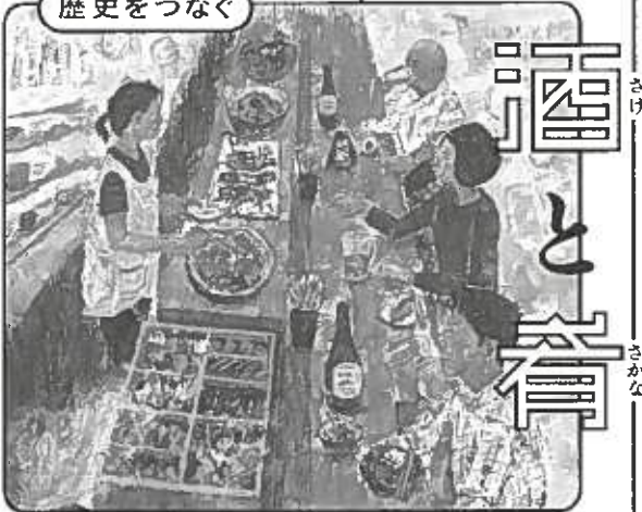
Illustration | Sugiyama Takumi

人は食卓を囲み 酒を飲み 話して笑って 生きてきた静岡の酒や肴の原料・材料に焦点をあて、料理や醸造の背景にある生物多様性を紹介します。