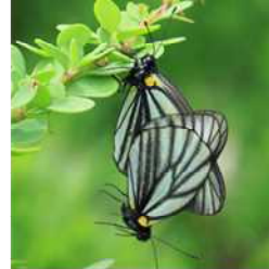
地域間の遺伝的な違いを推定