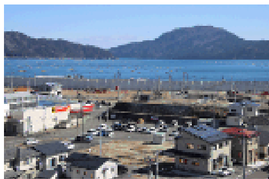
岩手県山田町の復興