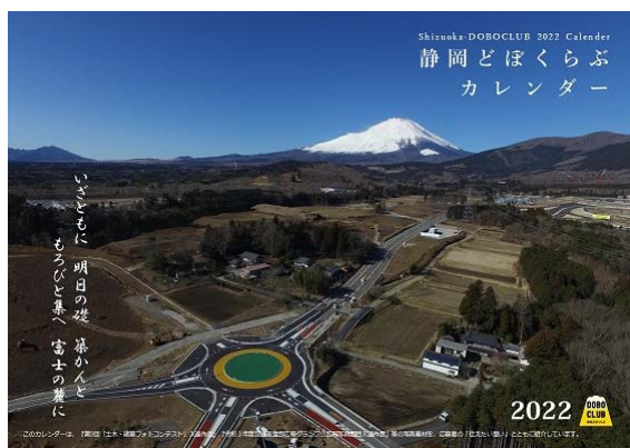
(1) 月めくりカレンダー