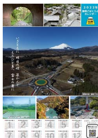
(2) ポスターカレンダー