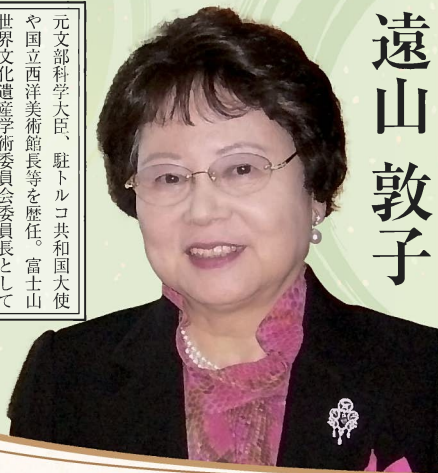
静岡県富士山世界遺産センター館長 遠山 敦子

元文部科学大臣、駐トルコ共和国大使や国立西洋美術館館長等を歴任。富士山世界文化遺産学術委員会委員長として富士山の世界遺産登録及び保存管理に尽力し、平成29年12月静岡県富士山世界遺産センター館長就任。