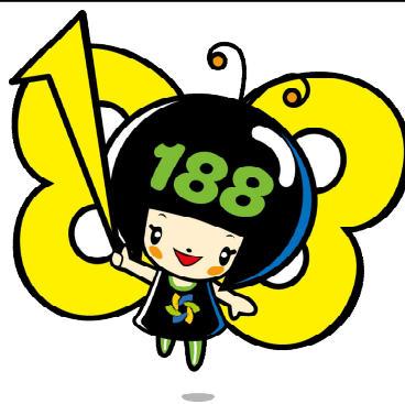
消費者庁 消費者ホットライン188 イメージキャラクター イヤヤン

受付時間外で相談窓口につながらない場合は、自動音声で受付時間や連絡先を御案内します。