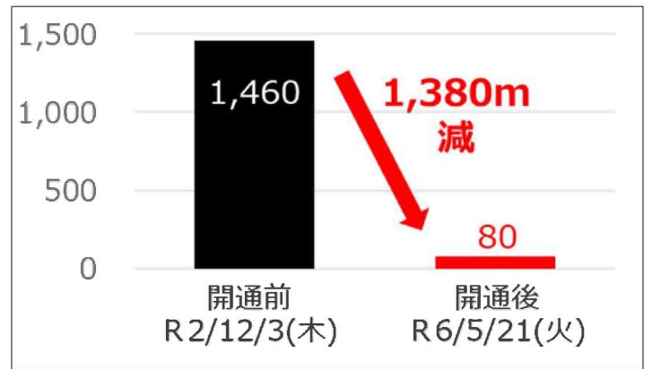
図2 富士川橋（主要渋滞箇所）の最大渋滞長 (m)