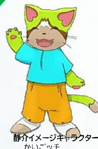
静介イメージキャラクター かいごち