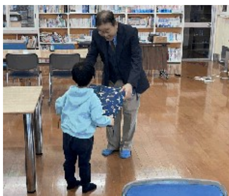
前回（令和5年度）の贈呈の様子