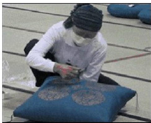
技能士による座布団制作

国家資格である「技能士」の技能水準の向上や社会的地位の安定を図り、社会における技能尊重の機運の醸成を推進することを目的に設置された団体です。22職種の技能士会が加盟しています。