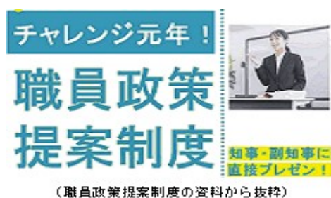
(職員政策提案制度の資料から抜粋)

人材の育成と活用の好循環を創出し、A Iを始めとするデジタル技術による組織の変革を新たなステージに引き上げます！